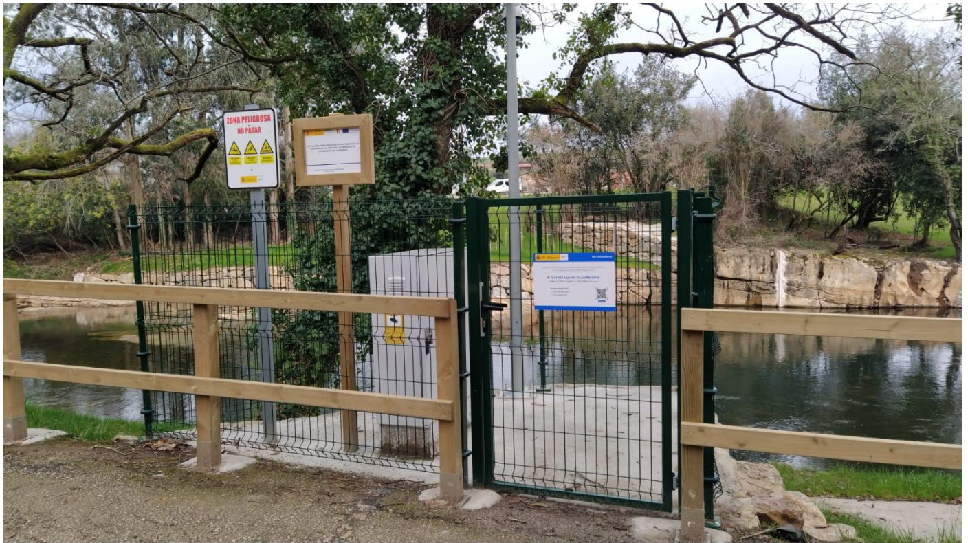
Control videovigilado con actualización cada cinco minutos