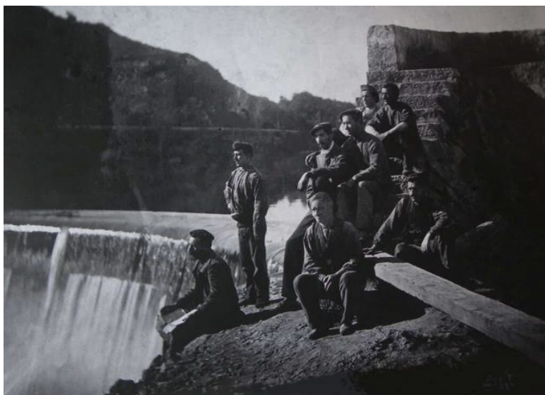
Trabajadores del El Pavón en la década de 1920 (Villapresente en la Memoria)

CONSEJERÍA DE CULTURA, TURISMO Y DEPORTE