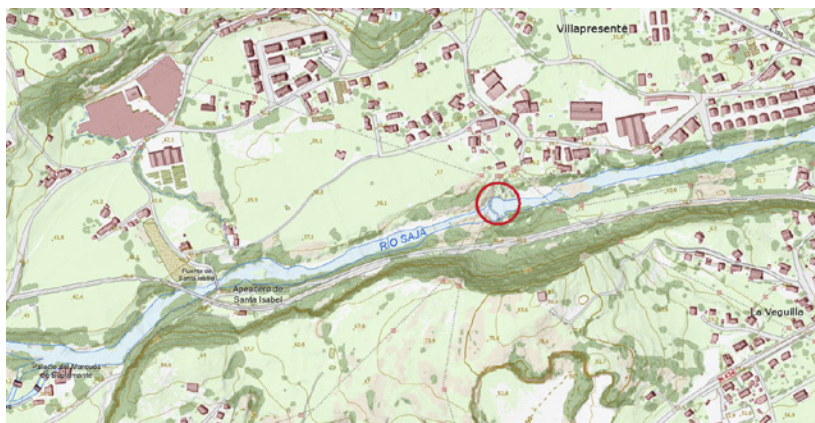
Plano de localización de la Central Eléctrica del Pavón (Mapas Cantabria)

Cerca de esta se localiza la chimenea de ladrillo de 50 metros de altura para la evacuación de gases de la caldera.