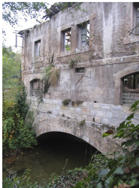
Edificio de turbinas, sala de máquinas y vivienda.