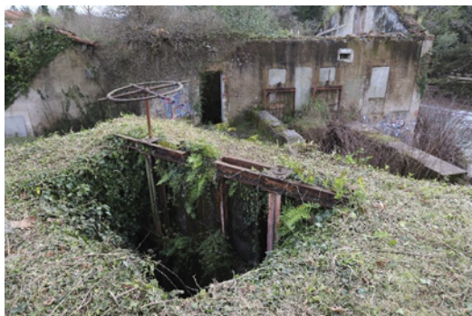
Compuertas de entrada.

CONSEJERÍA DE CULTURA, TURISMO Y DEPORTE