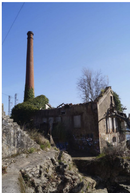
Edificio de turbinas, sala de máquinas y vivienda. Chimenea.