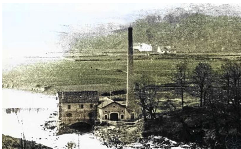
Central de El Pavón a principios del s. XX (Ayuntamiento del Reocín)

CONSEJERÍA DE CULTURA, TURISMO Y DEPORTE