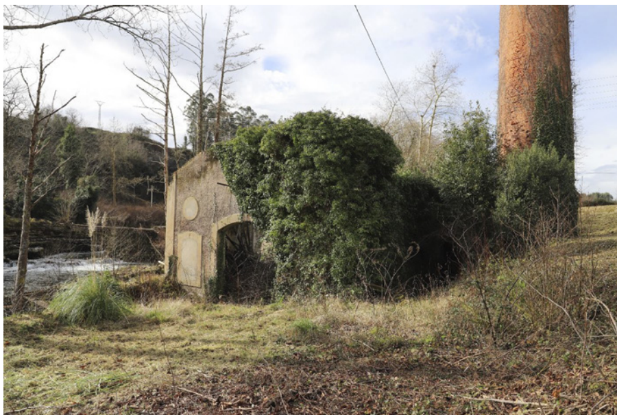
Edificio de oficinas y almacén