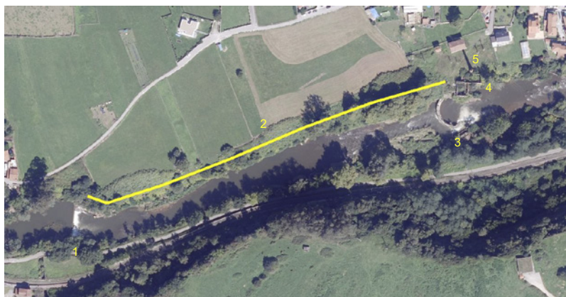
Ortofoto del conjunto de la central actualmente. 1-Azud, 2-Canal derivación subterráneo 3-Presa, 4-Edificios, 5-Chimenea.