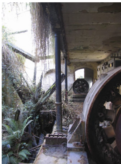
Sala de máquinas.