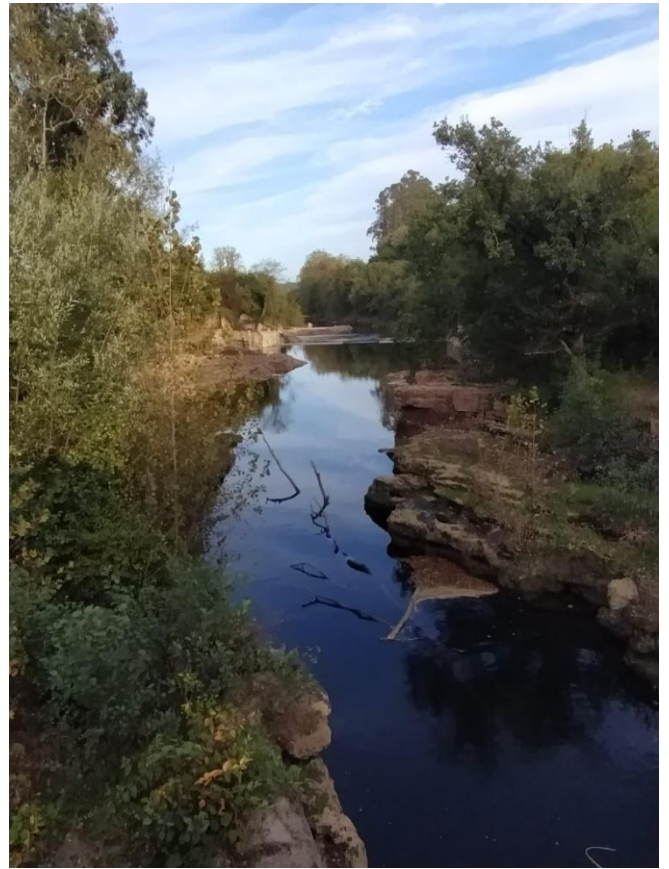
Al eliminar el dique de obras el nivel del agua bajo el Pontón ha bajado dos metros.