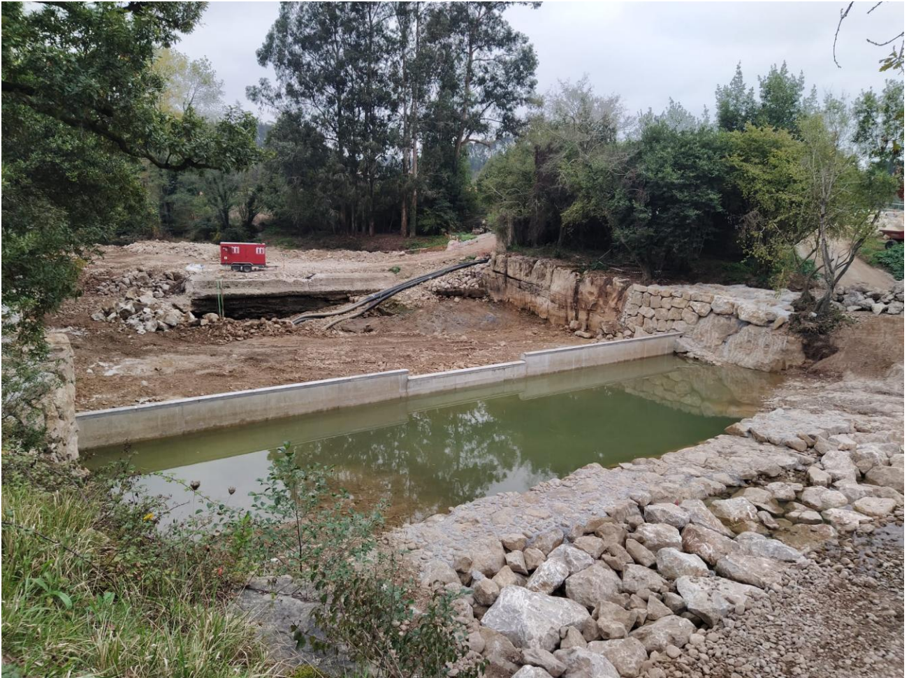
Piscina natural tras el muro de control