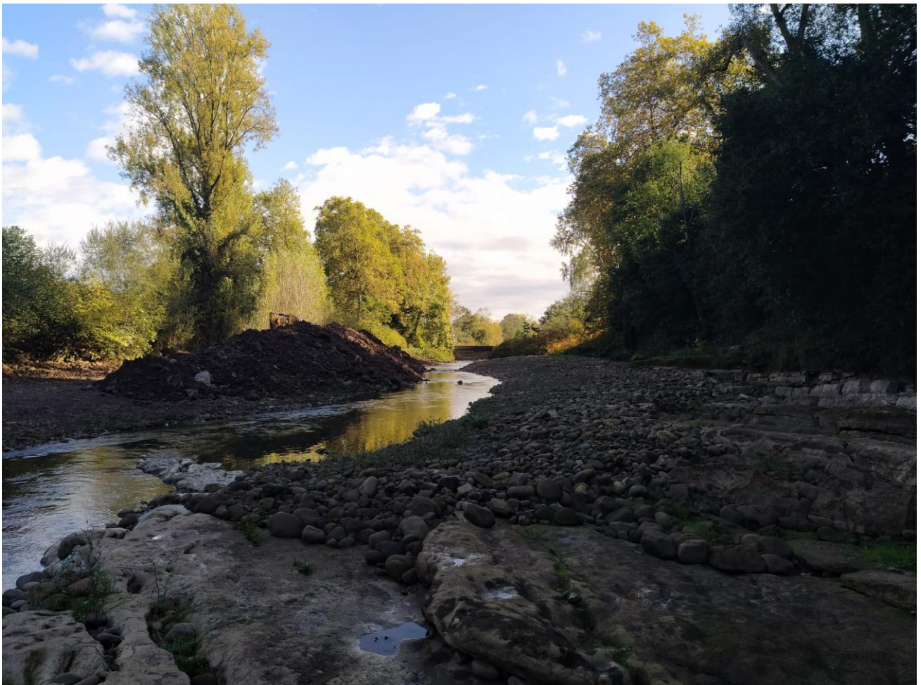
Movimientos de cantos rodados entre las dos presas