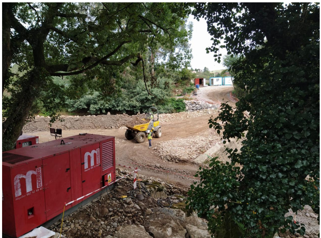
Se refuerza el dique de contención porque una violenta crecida del saja habría sido destructiva para las obras.