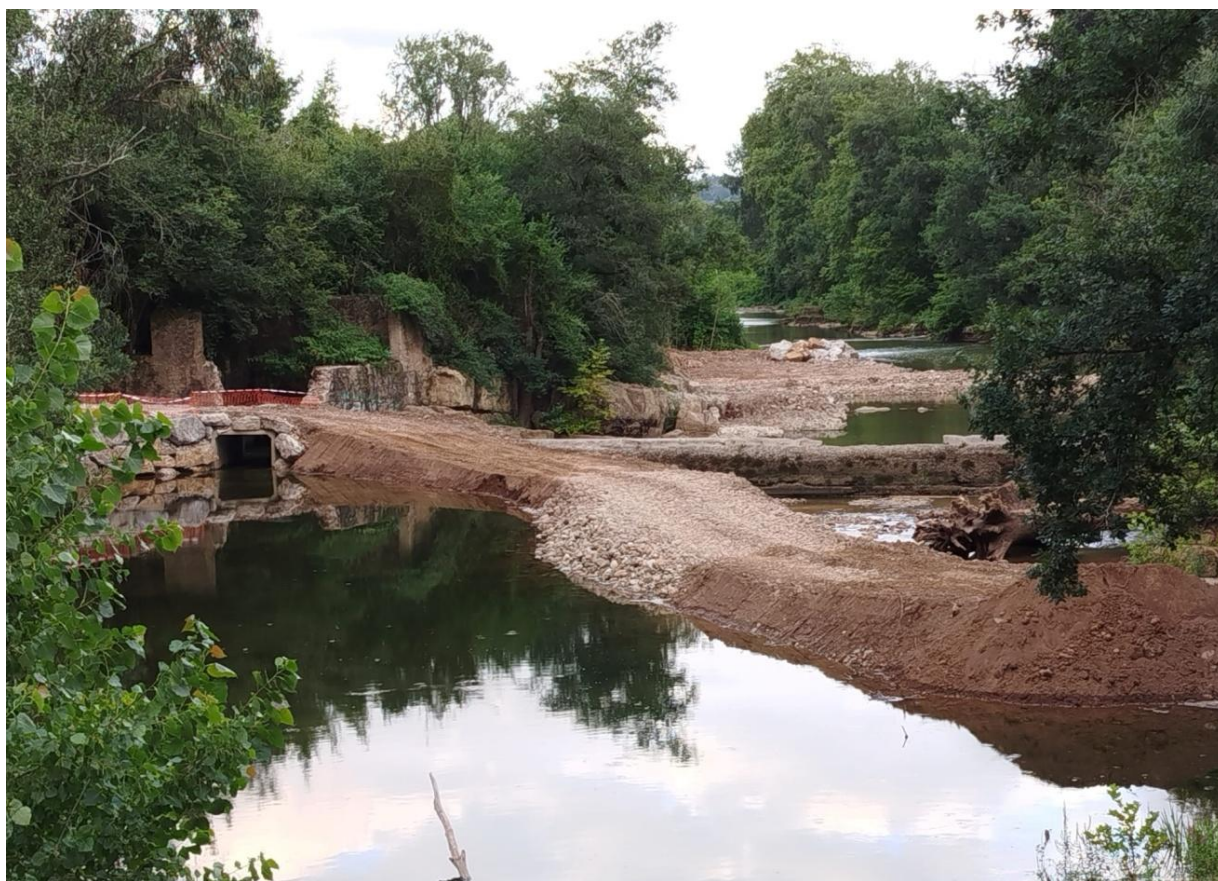
Se inician las obras del nuevo SAIH construyendo un dique que desvíe las aguas hacia el aliviadero abierto en las compuertas del canal de abastecimiento de la central eléctrica Pavón.