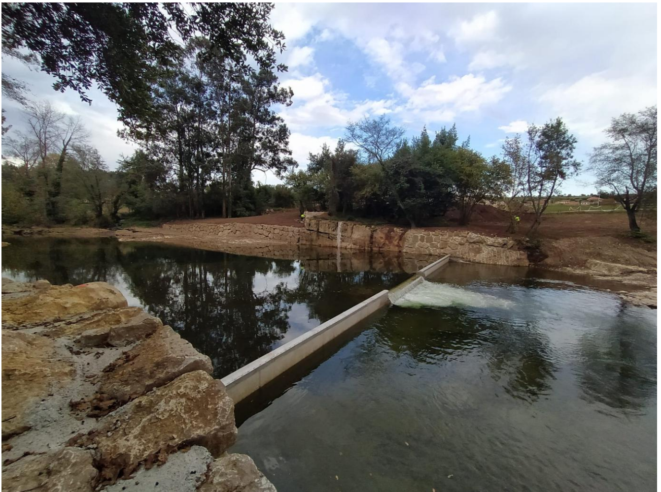
Aspecto final del SAI CHC