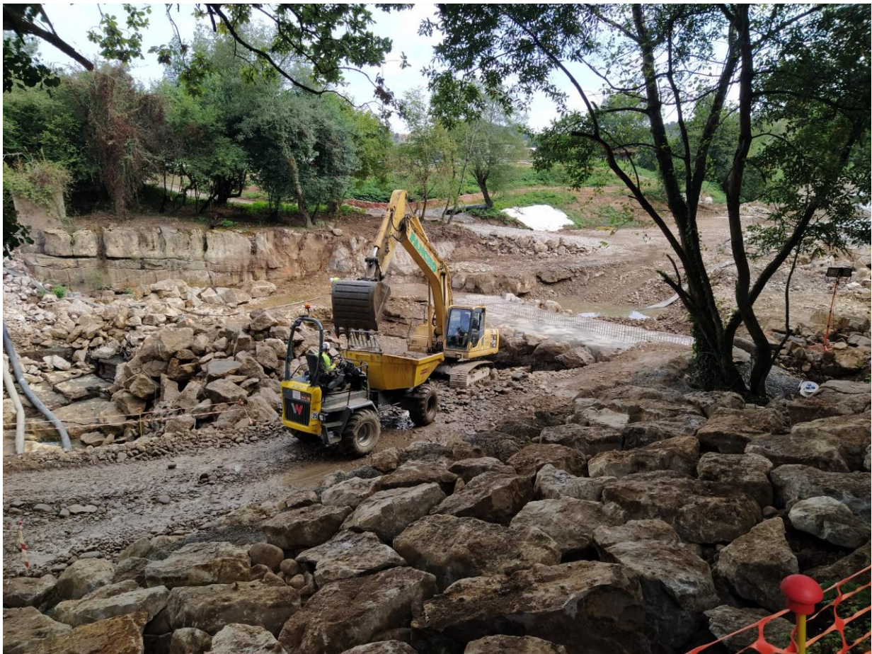
Las máquinas realizan un fortísimo impacto en la zona demoliendo los márgenes, construyendo rocas de protección y trasladando materiales para abrir los cimientos de la nueva presa.