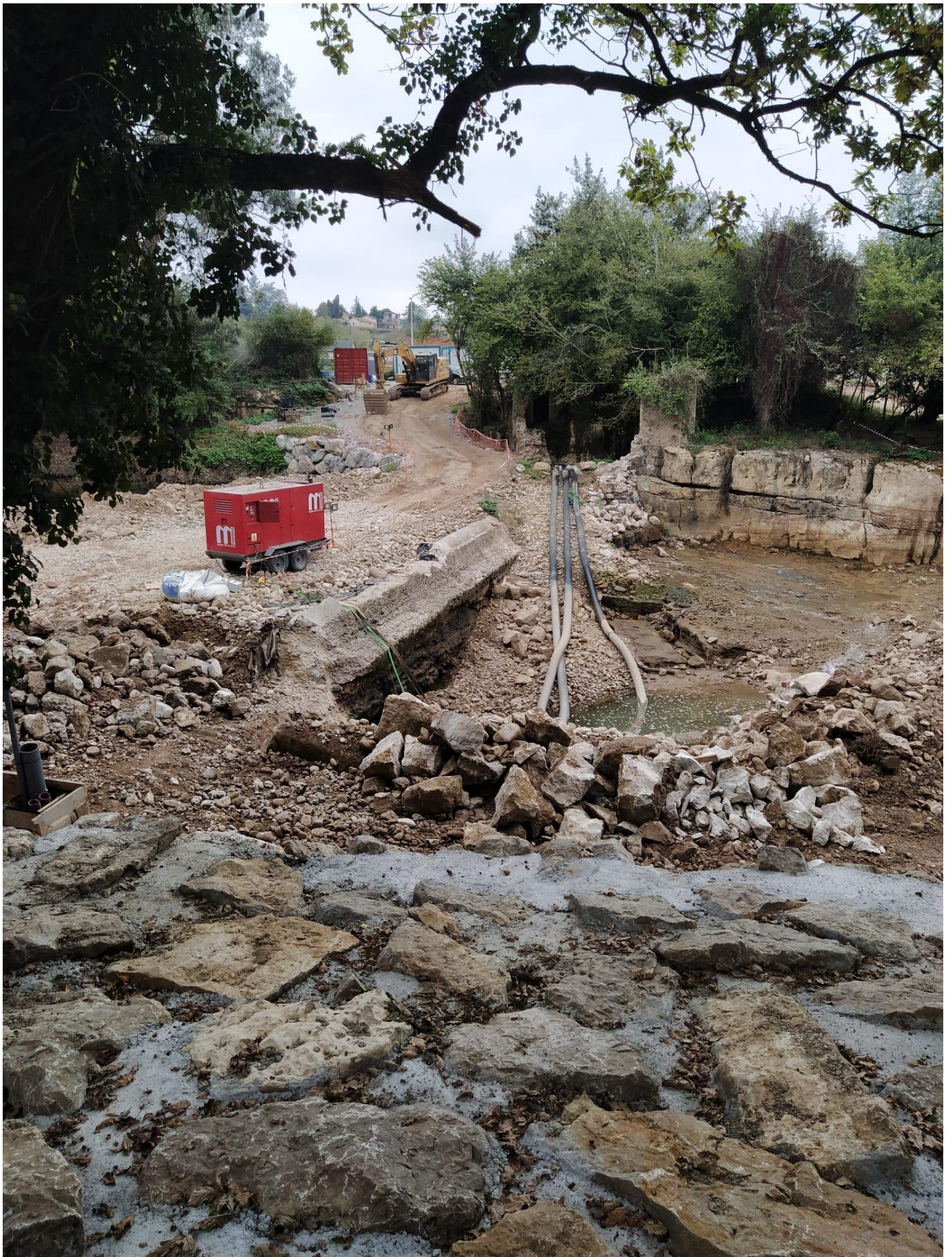
Demolición del azud de Pavón