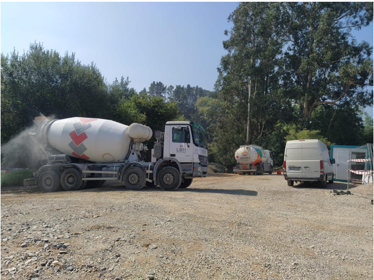
Proyecto ejecutado por Tragsa