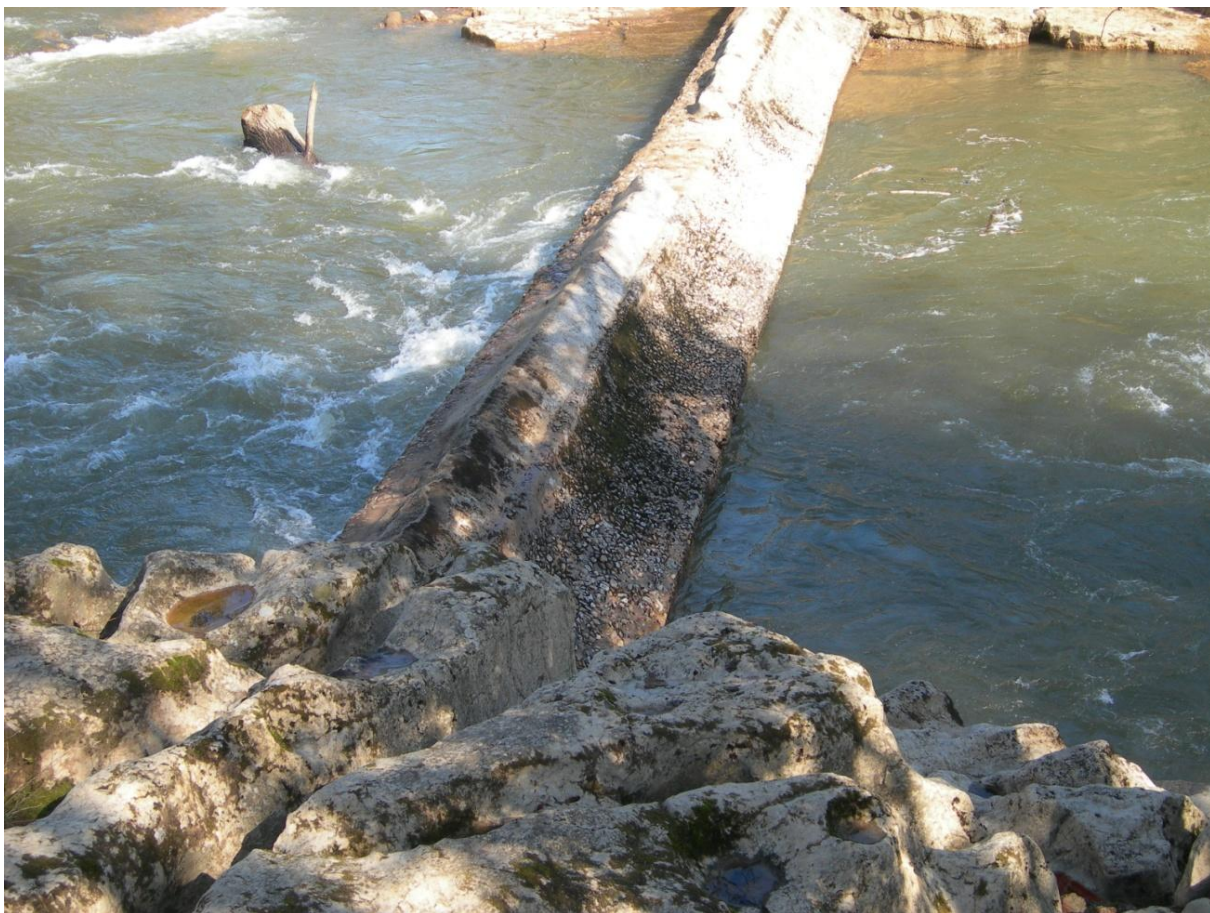
Las fuertes crecidas del río Saja en los últimos años habían ocasionado la rotura del azud en sus cimientos y el agua pasaba por debajo amenazando su estructura.