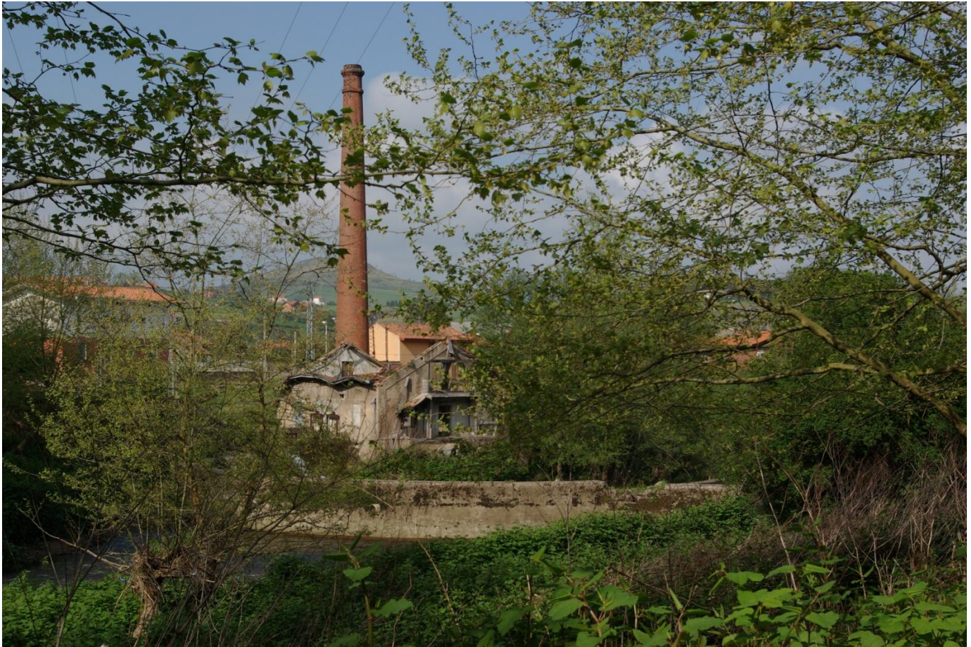
Estado ruinoso de la Central mixta de Pavón

El día 10 de febrero de 2025 “El Ministerio para la Transición Ecológica y el Reto Demográfico” a través de “La Confederación Hidrográfica del Cantábrico” comunica a los actuales propietarios de de central eléctrica de “Pavón” , “Enel Green Power España S.L.” declarar extinguido el derecho de aguas en el río Saja para la producción eléctrica y exigir la demolición de las infraestructuras con excepción del azud situado aguas arriba con la finalidad de destinarlo tras las reconversiones que procedan al control hidrológica del río Saja en este tramo por parte del Organismo de cuenca.