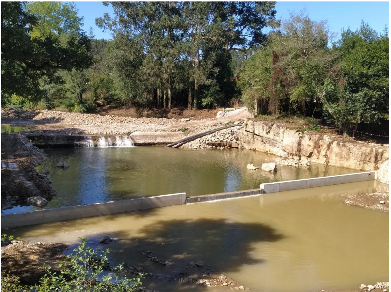
La presa tras quitar el encofrado